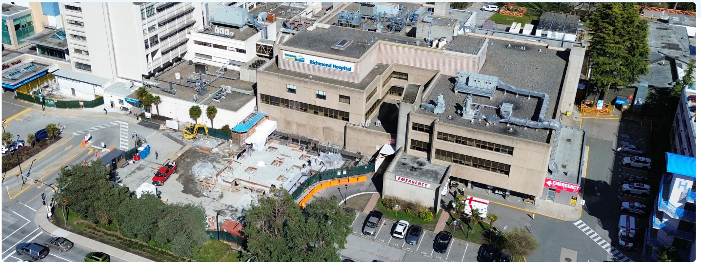
列治文医院现址视图