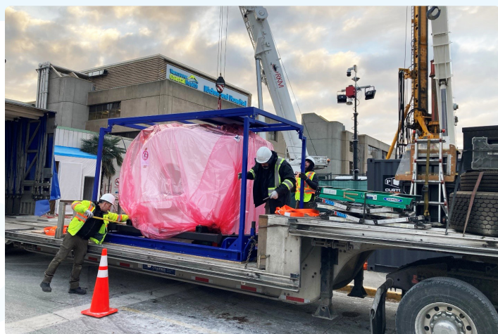
全新磁共振(MRI)扫描仪送抵列治文医院