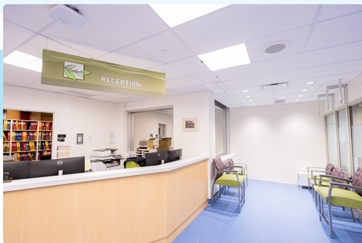
癌症护理诊所 - 接待处