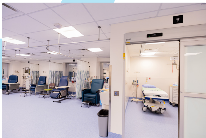
癌症护理诊所 - 患者检查室及治疗空间

列治文医院癌症护理诊所搬迁至Milan Ilich大楼的工程项目已于2023年11月底顺利完成, 该项目标志着新急症护理大楼的建设又迈进重要一步。