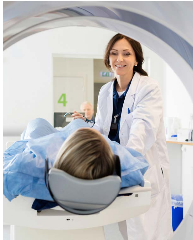
医生准备为患者使用电脑断层扫描 (CT)