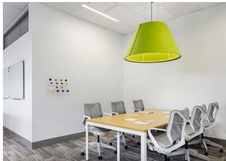
上: Foundry Richmond 团队成员 中: Foundry Richmond 的医疗检查室 下: Foundry Richmond 的会议空间